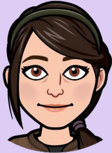
She / Ella